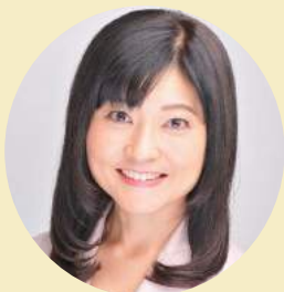
あいざき佐和子伊丹市議会議員